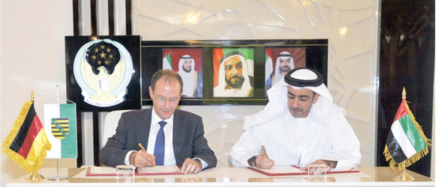
S.E. Markus Ulbig, Innenminister des Freistaats Sachsen und S.H. Generalleutnant Sheikh Saif Bin Zayed Al Nahyan, stellvertretender Premierminister und Innenminister der Vereinigten Arabischen Emirate

توقيع إعلان تعاون مشترك في المجالات الشرطية بين الإمارات و مقاطعة ساكسونيا في جمهورية ألمانيا الاتحادية